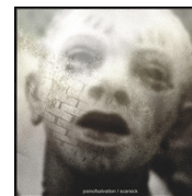
Pain of Salvation - Scarsick